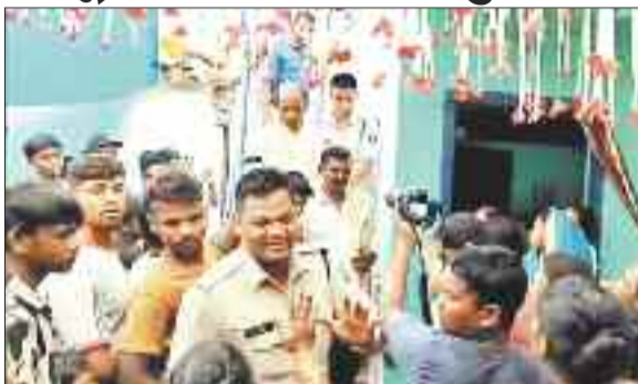
दुल्हे को सुरक्षित लेकर जाती पुलिस।