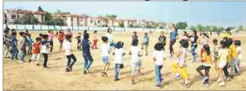
समर कैंप में शामिल बच्चे।