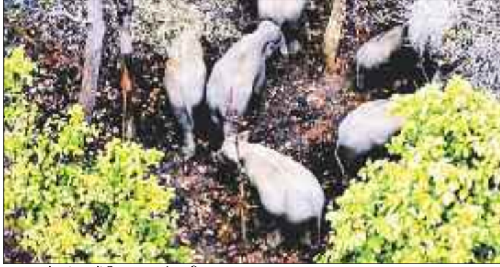
कुदमुरा के जंगल में विचरण करते हाथी।