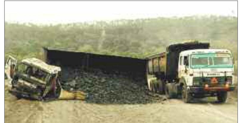
दुर्घटनाग्रस्त ट्रेलर वाहन।

जिले के सर्वमंगला कनवेरी मार्ग पर सर्वमंगला मंदिर के पीछे निर्माणाधीन रेलवे ब्रिज के पास चढ़ाई के दौरान सुबह एक कोयला लोड ट्रेलर क्रमांक सीजी 10 सी 8369 फिसलते हुए पलटा गई। चालक को मामूली चोट आई है। बताया जा रहा है कि जिस वक्त ये हादसा हुआ हल्के वाहन आसपास से गुजर रहे थे, गनीमत ये रही कि कोई पलटते हुए भारी वाहन कि चपेट में नहीं आया अन्यथा बड़ा हादसा हो सकता था। इस स्थान पर बड़े बड़े गड्डे हो गए हैं जिस वजह से यहां हर दिन एक या दो ट्रेलर फंसे रहते हैं, अथवा हादसे का शिकार हो जाते हैं।