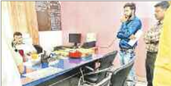
अधीक्षण यंत्रों को ज्ञापन सौंपते सब स्टेशन कर्मी।

उल्लेखनीय है कि जिले में 50 से अधिक सब स्टेशन हैं। जिन सब स्टेशन का संचालन विद्युत विभाग द्वारा जेबीएस नामक ठेका कंपनी को दिया गया है। जेबीएस ठेका कंपनी के अधीन लगभग 200 से अधिक ठेका कर्मी सब स्टेशन में चार अलग-अलग पालियों में ड्यूटी करते हैं। इन सभी ठेका कर्मियों को जेबीएस नामक ठेका कंपनी द्वारा 2 महीने का ना ही वेतन दिया गया है और ना ही 6 महीने का बोनस दिया गया है। ठेका कर्मी लगातार अपने वेतन के लिए ठेकेदार व अधिकारियों से गुहार